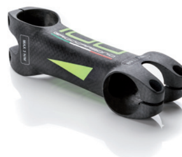
L. 100 ○