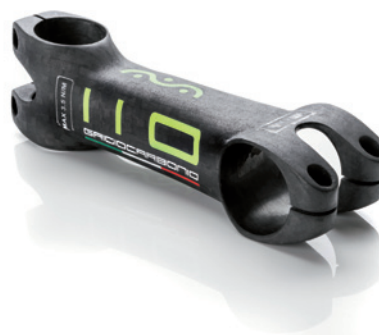
L. 110 ○