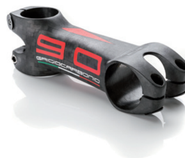
L. 90 ○