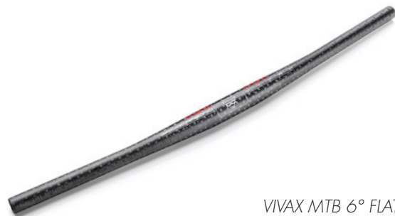
VIVAX MTB 6° FLAT ○