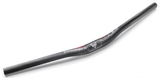
VIVAX MTB 11° ○