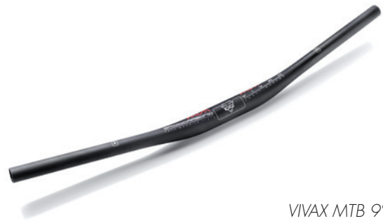
VIVAX MTB 9° ○